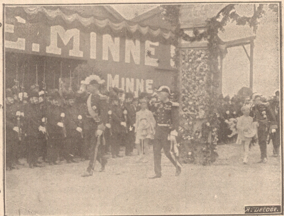
De blijde intrede van Koning Albrecht te Gent.