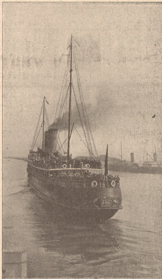
JAN BREYDEL Maalboot van den Belgischen Staat.

Leest in ons volgend nummer een belangrijk artikel, met platen, over zeevaart, door Ern. de Spot, onderaalmoezenier op zee.